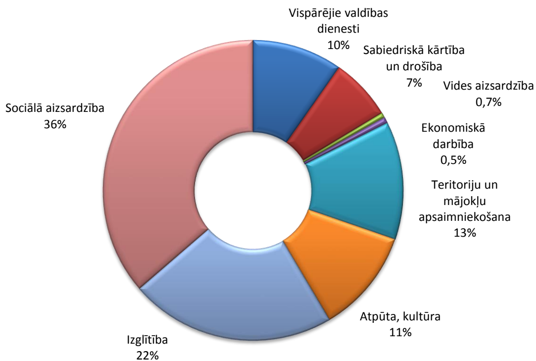
2.att. Tērvetes novada domes budžeta izdevumi atbilstoši funkcionālajām kategorijām 2019.gadā